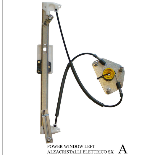
POWER WINDOW LEFT ALZACRISTALLI ELETTRICO SX A

THIS INSTALLATION INSTRUCTION IS FOR BOTH LEFT AND RIGHT SIDE. CETTE INSTRUCTION DE MONTAGE EST POUR LES DEUX COTES DROIT ET GAUCHE. DIESE MONTAGE-ANLEITUNG IST FÜR DIE BEIDE LINKE UND RECHTE SEITE. ESTA INSTRUCCION DE MONTAJE ES PARA LOS DOS LADOS IZQUIERDO Y DERECHO. ESTAS INSTRUÇÕES VALEM TANTO PARA O LADO ESQUERDO QUANTO PARA O DIREITO. LA PRESENTE ISTRUZIONE VALE SIA PER IL LATO SINISTRO CHE PER IL LATO DESTRO.