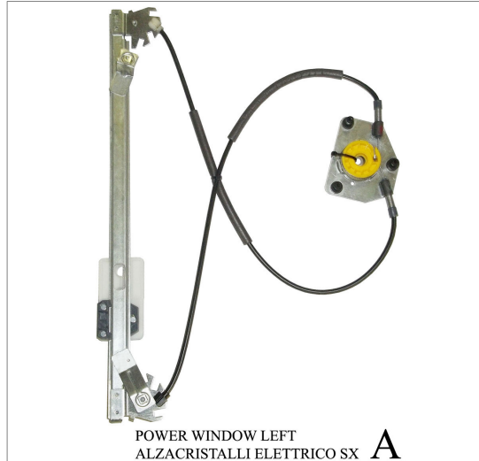
POWER WINDOW LEFT ALZACRISTALLI ELETTRICO SX A

THIS INSTALLATION INSTRUCTION IS FOR BOTH LEFT AND RIGHT SIDE. CETTE INSTRUCTION DE MONTAGE EST POUR LES DEUX COTES DROIT ET GAUCHE. DIESE MONTAGE-ANLEITUNG IST FÜR DIE BEIDE LINKE UND RECHTE SEITE. ESTA INSTRUCCION DE MONTAJE ES PARA LOS DOS LADOS IZQUIERDO Y DERECHO. ESTAS INSTRUÇÕES VALEM TANTO PARA O LADO ESQUERDO QUANTO PARA O DIREITO. LA PRESENTE ISTRUZIONE VALE SIA PER IL LATO SINISTRO CHE PER IL LATO DESTRO.