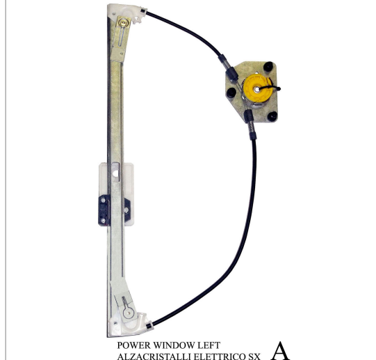
POWER WINDOW LEFT ALZACRISTALLI ELETTRICO SX A

THIS INSTALLATION INSTRUCTION IS FOR BOTH LEFT AND RIGHT SIDE. CETTE INSTRUCTION DE MONTAGE EST POUR LES DEUX COTES DROIT ET GAUCHE. DIESE MONTAGE-ANLEITUNG IST FÜR DIE BEIDE LINKE UND RECHTE SEITE. ESTA INSTRUCCION DE MONTAJE ES PARA LOS DOS LADOS IZQUIERDO Y DERECHO. ESTAS INSTRUÇÕES VALEM TANTO PARA O LADO ESQUERDO QUANTO PARA O DIREITO. LA PRESENTE ISTRUZIONE VALE SIA PER IL LATO SINISTRO CHE PER IL LATO DESTRO.