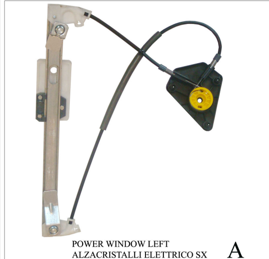
POWER WINDOW LEFT ALZACRISTALLI ELETTRICO SX A

THIS INSTALLATION INSTRUCTION IS FOR BOTH LEFT AND RIGHT SIDE. CETTE INSTRUCTION DE MONTAGE EST POUR LES DEUX COTES DROIT ET GAUCHE. DIESE MONTAGE-ANLEITUNG IST FÜR DIE BEIDE LINKE UND RECHTE SEITE. ESTA INSTRUCCION DE MONTAJE ES PARA LOS DOS LADOS IZQUIERDO Y DERECHO. ESTAS INSTRUÇÕES VALEM TANTO PARA O LADO ESQUERDO QUANTO PARA O DIREITO. LA PRESENTE ISTRUZIONE VALE SIA PER IL LATO SINISTRO CHE PER IL LATO DESTRO.