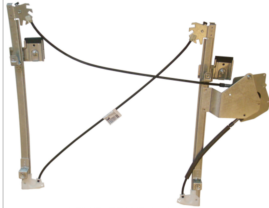
POWER WINDOW LEFT ALZACRISTALLI ELETTRICO SX

THIS INSTALLATION INSTRUCTION IS FOR BOTH LEFT AND RIGHT SIDE. CETTE INSTRUCTION DE MONTAGE EST POUR LES DEUX COTES DROIT ET GAUCHE. DIESE MONTAGE-ANLEITUNG IST FÜR DIE BEIDE LINKE UND RECHTE SEITE. ESTA INSTRUCCION DE MONTAJE ES PARA LOS DOS LADOS IZQUIERDO Y DERECHO. ESTAS INSTRUÇÕES VALEM TANTO PARA O LADO ESQUERDO QUANTO PARA O DIREITO. LA PRESENTE ISTRUZIONE VALE SIA PER IL LATO SINISTRO CHE PER IL LATO DESTRO.