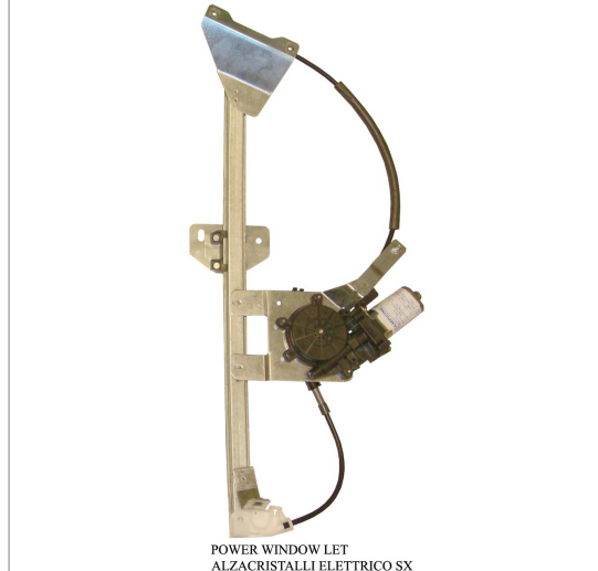
POWER WINDOW LET ALZACRISTALLI ELETTRICO SX

THIS INSTALLATION INSTRUCTION IS FOR BOTH LEFT AND RIGHT SIDE. CETTE INSTRUCTION DE MONTAGE EST POUR LES DEUX COTES DROIT ET GAUCHE. DIESE MONTAGE-ANLEITUNG IST FÜR DIE BEIDE LINKE UND RECHTE SEITE. ESTA INSTRUCCION DE MONTAJE ES PARA LOS DOS LADOS IZQUIERDO Y DERECHO. AS PRESENTES INSTRUÇÕES VALEM TANTO PARA O LADO ESQUERDO QUANTO PARA O DIREITO. LA PRESENTE ISTRUZIONE VALE SIA PER IL LATO SINISTRO CHE PER IL LATO DESTRO.