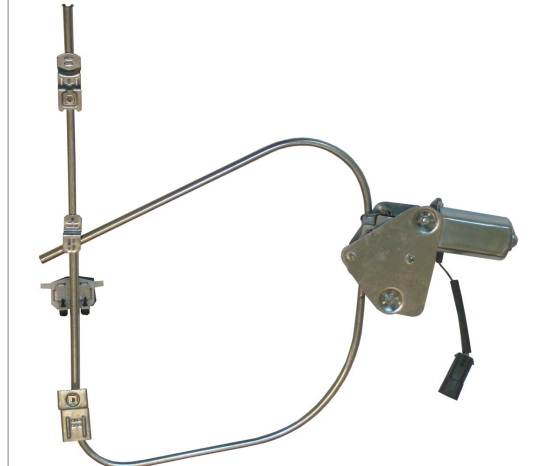
POWER WINDOW LEFT ALZACRISTALLI ELETTRICO SX

THIS INSTALLATION INSTRUCTION IS FOR BOTH LEFT AND RIGHT SIDE. CETTE INSTRUCTION DE MONTAGE EST POUR LES DEUX COTES DROIT ET GAUCHE. DIESE MONTAGE-ANLEITUNG IST FÜR DIE BEIDE LINKE UND RECHTE SEITE. ESTA INSTRUCCION DE MONTAJE ES PARA LOS DOS LADOS IZQUIERDO Y DERECHO. AS PRESENTES INSTRUÇÕES VALEM TANTO PARA O LADO ESQUERDO QUANTO PARA O DIREITO. LA PRESENTE ISTRUZIONE VALE SIA PER IL LATO SINISTRO CHE PER IL LATO DESTRO.