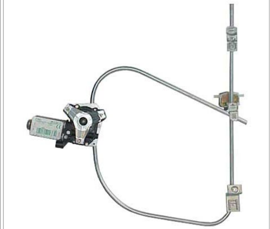
ORIGINAL POWER WINDOW RIGHT ALZACRISTALLI ELETTRICO ORIGINALE DX