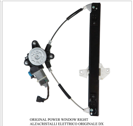
ORIGINAL POWER WINDOW RIGHT ALZACRISTALLI ELETTRICO ORIGINALE DX