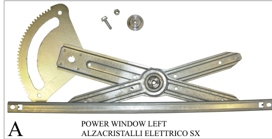
A POWER WINDOW LEFT ALZACRISTALLI ELETTRICO SX

THESE INSTRUCTIONS ARE FOR BOTH THE LEFT AND RIGHT SIDES. CETTE INSTRUCTION DE MONTAGE EST VALABLE AUSSI BIEN POUR LE CÔTÉ GAUCHE QUE POUR LE CÔTÉ DROIT. DIESE ANLEITUNG GILT FÜR LINKS- UND RECHTSSEITIGE MONTAGE. ESTAS INSTRUCCIONES SE APLICAN TANTO A LAS PUERTAS DERECHAS COMO A LAS IZQUIERDAS. ESTAS INSTRUÇÕES VALEM TANTO PARA O LADO ESQUERDO QUANTO PARA O DIREITO. DEZE AANWIJZINGEN GELDEN VOOR ZOWEL DE LINKER- ALS DE RECHTERKANT. Η ΠΑΡΟΥΣΑ ΟΔΗΓΙΑ ΑΦΟΡΑ ΤΟΣΟ ΤΗΝ ΑΡΙΣΤΕΡΗ ΟΣΟ ΚΑΙ ΤΗ ΔΕΞΙΑ ΠΛΕΥΡΑ. LA PRESENTE ISTRUZIONE VALE SIA PER IL LATO SINISTRO CHE PER IL LATO DESTRO.