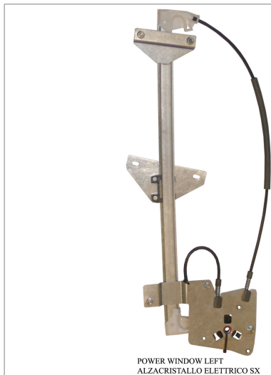
POWER WINDOW LEFT ALZACRISTALLO ELETTRICO SX

THIS INSTALLATION INSTRUCTION IS FOR BOTH LEFT AND RIGHT SIDE. CETTE INSTRUCTION DE MONTAGE EST POUR LES DEUX COTES DROIT ET GAUCHE. DIESE MONTAGE-ANLEITUNG IST FÜR DIE BEIDE LINKE UND RECHTE SEITE. ESTA INSTRUCCION DE MONTAJE ES PARA LOS DOS LADOS IZQUIERDO Y DERECHO. ESTAS INSTRUÇÕES VALEM TANTO PARA O LADO ESQUERDO QUANTO PARA O DIREITO. DEZE AANWIJZINGEN GELDEN VOOR ZOWEL DE LINKER- ALS DE RECHTERKANT. Η ΠΑΡΟΥΣΑ ΟΔΗΓΙΑ ΑΦΟΡΑ ΤΟΣΟ ΤΗΝ ΑΡΙΣΤΕΡΗ ΟΣΟ ΚΑΙ ΤΗ ΔΕΞΙΑ ΠΛΕΥΡΑ. LA PRESENTE ISTRUZIONE VALE SIA PER IL LATO SINISTRO CHE PER IL LATO DESTRO.