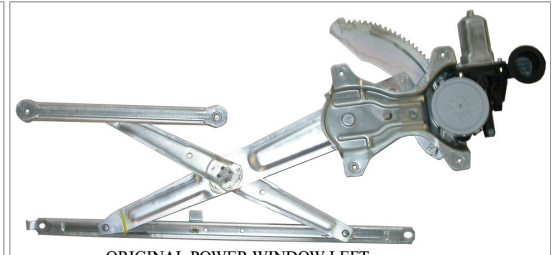
ORIGINAL POWER WINDOW LEFT ALZACRISTALLO ELETTRICO ORIGINALE SX