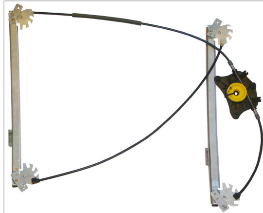
A POWER WINDOW LEFT ALZACRISTALLI ELETTRICO SX

THIS INSTALLATION INSTRUCTION IS FOR BOTH LEFT AND RIGHT SIDE. CETTE INSTRUCTION DE MONTAGE EST POUR LES DEUX COTES DROIT ET GAUCHE. DIESE MONTAGE-ANLEITUNG IST FÜR DIE BEIDE LINKE UND RECHTE SEITE. ESTA INSTRUCCION DE MONTAJE ES PARA LOS DOS LADOS IZQUIERDO Y DERECHO. ESTAS INSTRUÇÕES VALEM TANTO PARA O LADO ESQUERDO QUANTO PARA O DIREITO. DEZE AANWIJZINGEN GELDEN VOOR ZOWEL DE LINKER- ALS DE RECHTERKANT. Η ΠΑΡΟΥΣΑ ΟΔΗΓΙΑ ΑΦΟΡΑ ΤΟΣΟ ΤΗΝ ΑΡΙΣΤΕΡΗ ΟΣΟ ΚΑΙ ΤΗ ΔΕΞΙΑ ΠΛΕΥΡΑ. LA PRESENTE ISTRUZIONE VALE SIA PER IL LATO SINISTRO CHE PER IL LATO DESTRO.